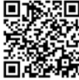
QR-kod till V8:s race-sida